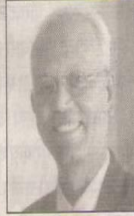
सुप्रसिद्ध शास्त्रज्ञ मा. डॉ. रघुनाथ माशेलकर यांना